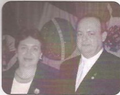
Prefeito Municipal de Porto Xavier

Existem pessoas que lutam somente um dia, mas estas são necessárias.