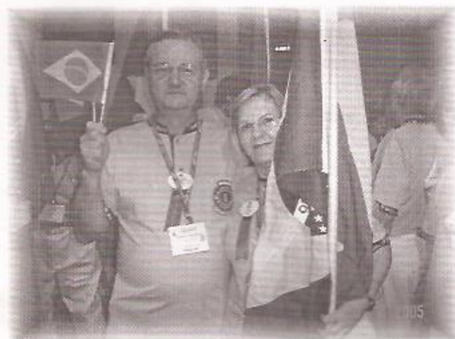
DESFILE DAS DELEGAÇÕES