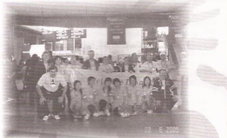
RECEPÇÃO NO AEROPORTO