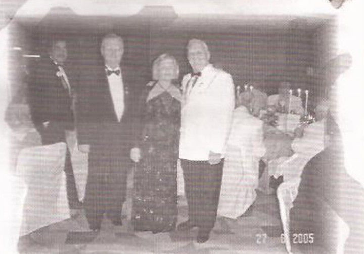
CASAL GOVERNADOR COM EX-PRESIDENTE INTERNACIONAL CL AUGUSTIN SOLIVA