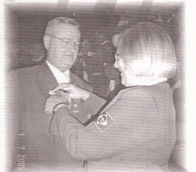
MOMENTO DA POSSE