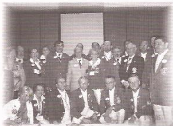
SEMINÁRIO DE GOVERNADORES