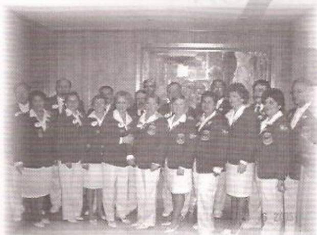
COLEGIADO DO MÚLTIPLO LD