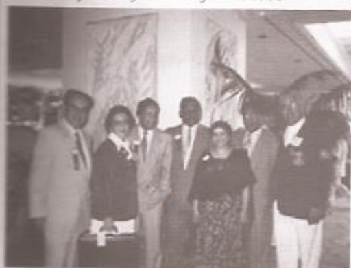
O governador Eloy Garrido reuniu-se com a delegação da Índia na Convenção de LIONS