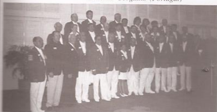
Delegação brasileira composta por 30 novos governadores de LIONS tomaram posse oficial em junho/2000