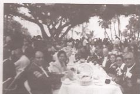
Um momento de confraternização, que possibilitou uma integração entre os participantes da Convenção Internacional de LIONS, no parque do centro de convenções em Honolulu-Havaí